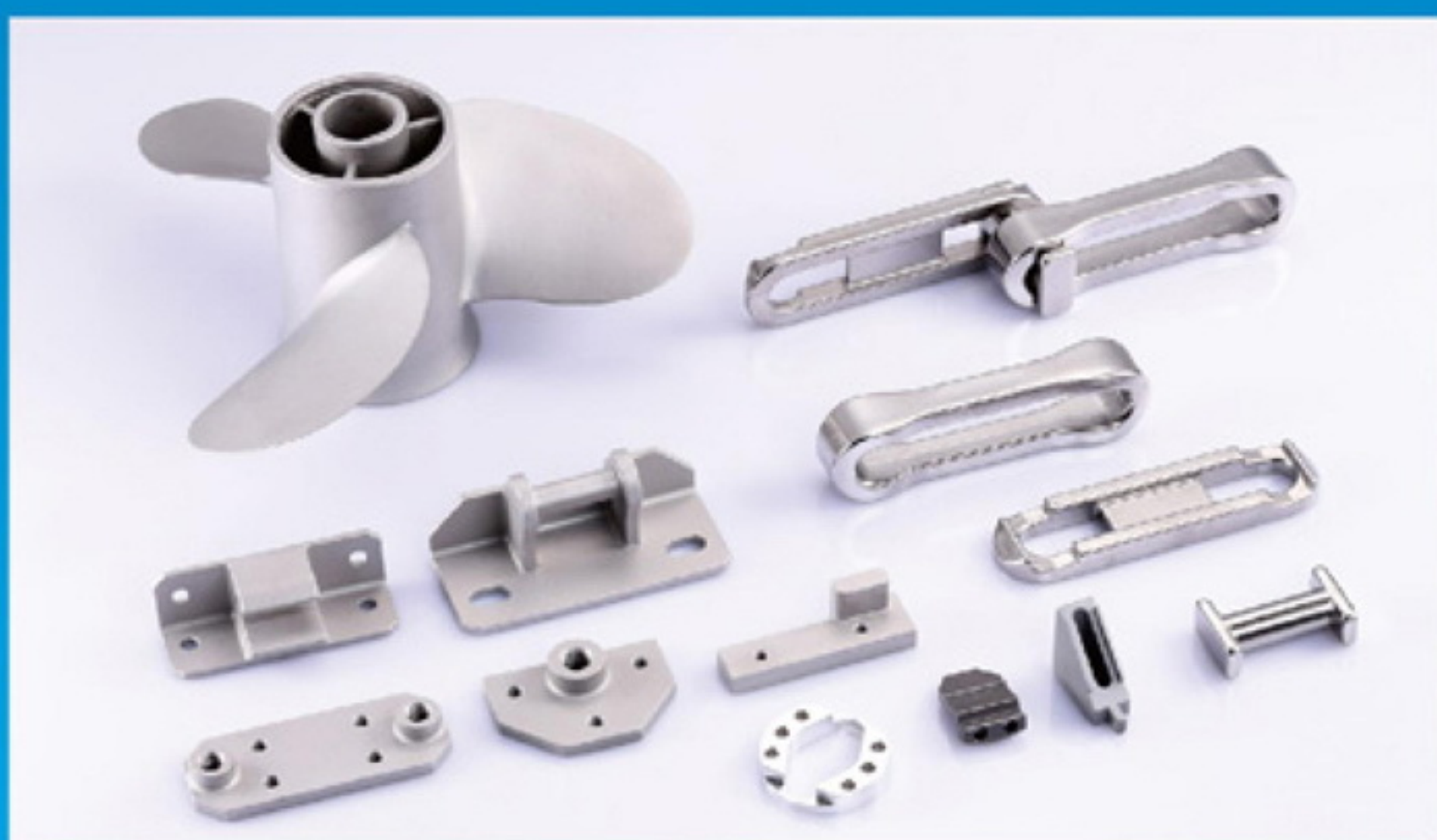
▼ 各種搬送用具部品

電車、軌道、ベルトコンベア、各種チェーン、タービン・ホイール等に幅広く応用されています。