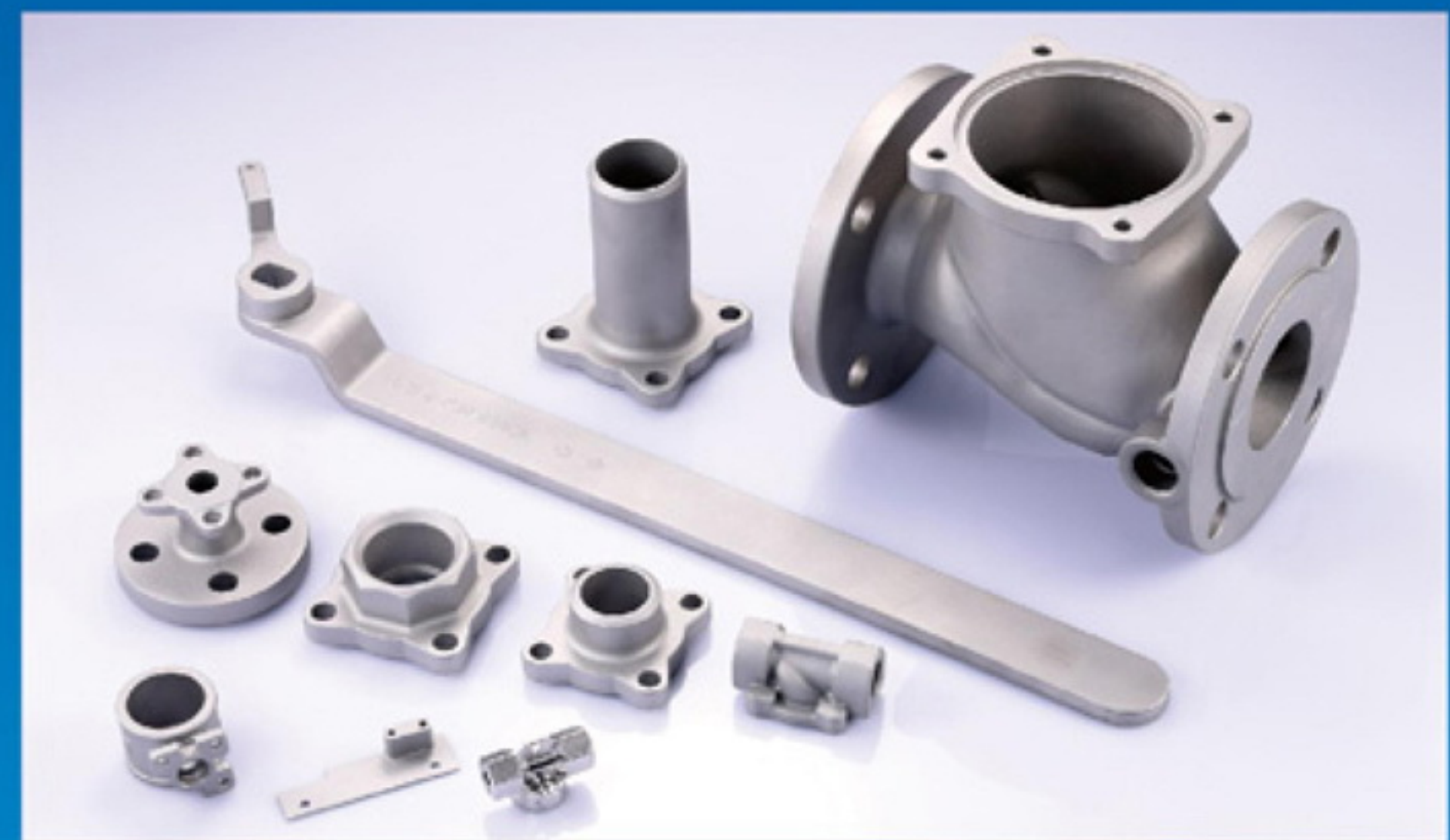
▼ 各種バルブ類部品